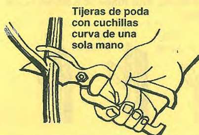
Tijeras de poda con cuchillas curva de una sola mano