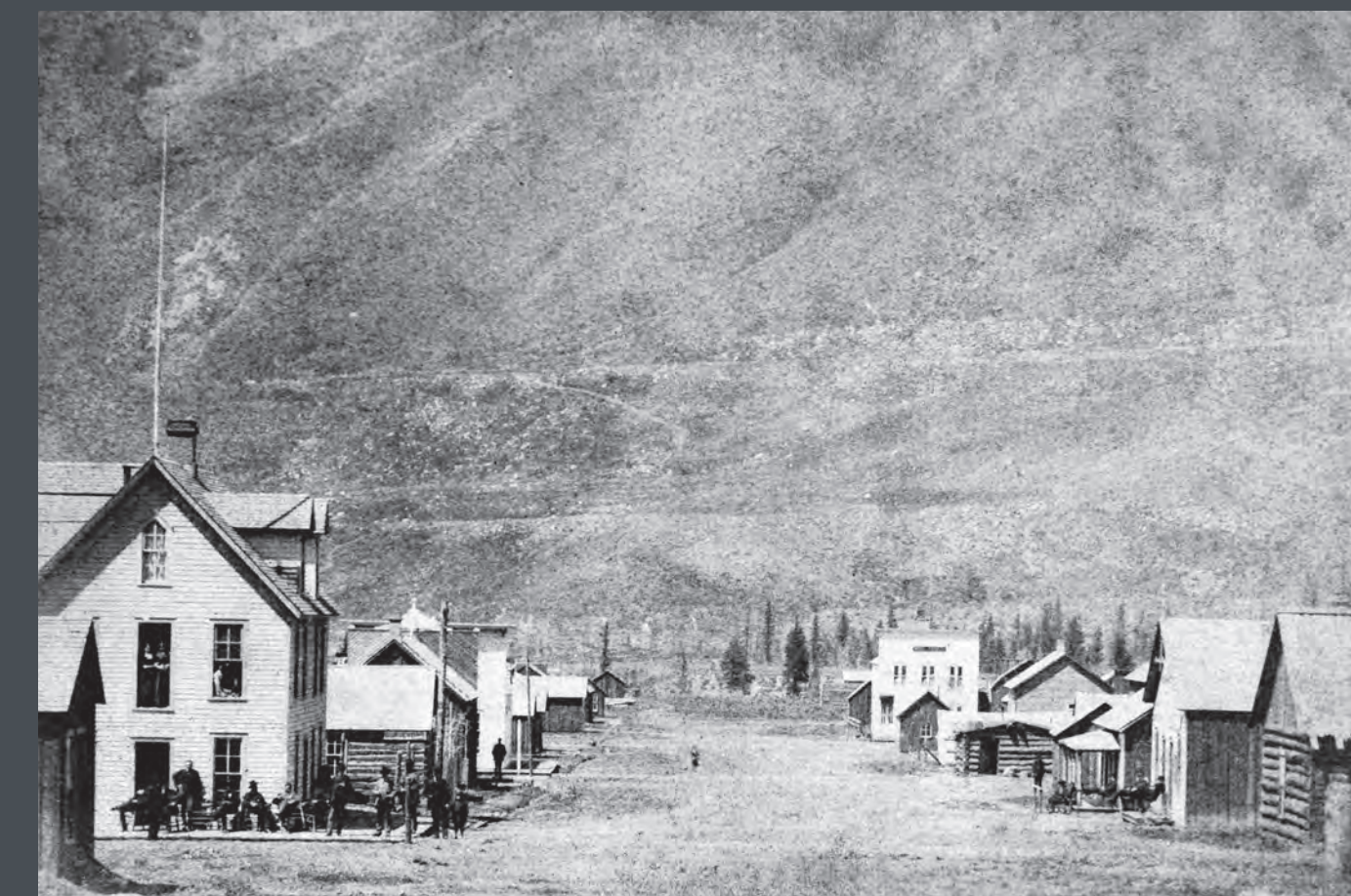
Mill Street, Circa 1883

Los buscadores de oro exploraban y reclamaban concesiones mineras de plata, pero se extraía poco mineral debido a la falta de una fundición local y a la dificultad de transportar el mineral a la más cercana, en Leadville.