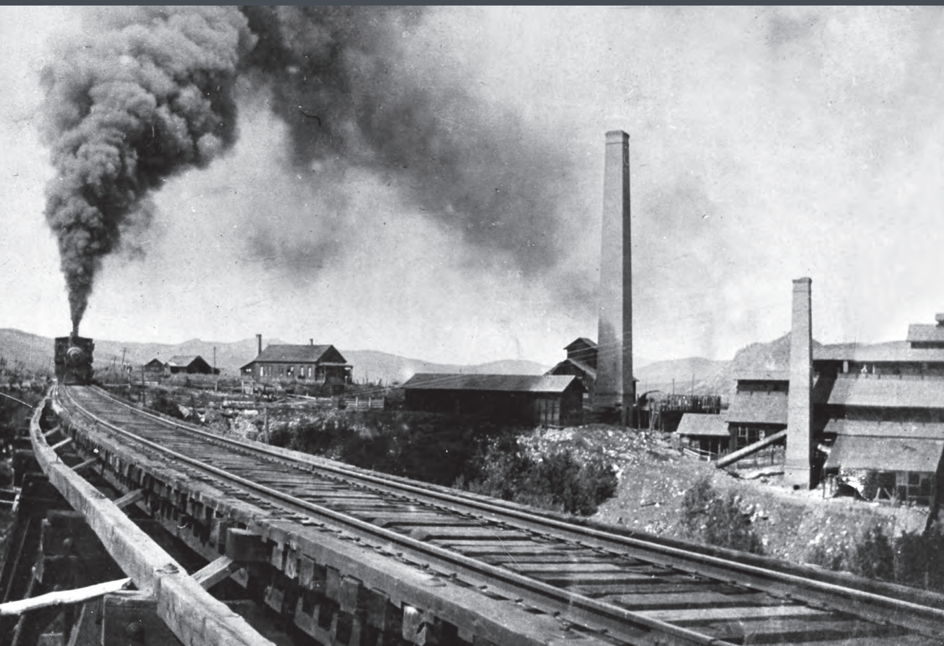
Holden Lixiviation Works y Midland de Colorado, circa 1895

El sitio funcionó como planta concentradora durante los siguientes ocho años, separando los minerales valiosos de la roca estéril para las minas locales y reduciendo el volumen de material transportado por tren de carga.