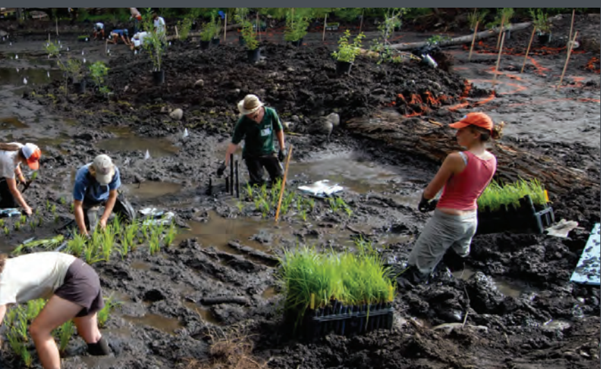
Docenas de voluntarios colaboraron en la plantación de los humedales en 2007.