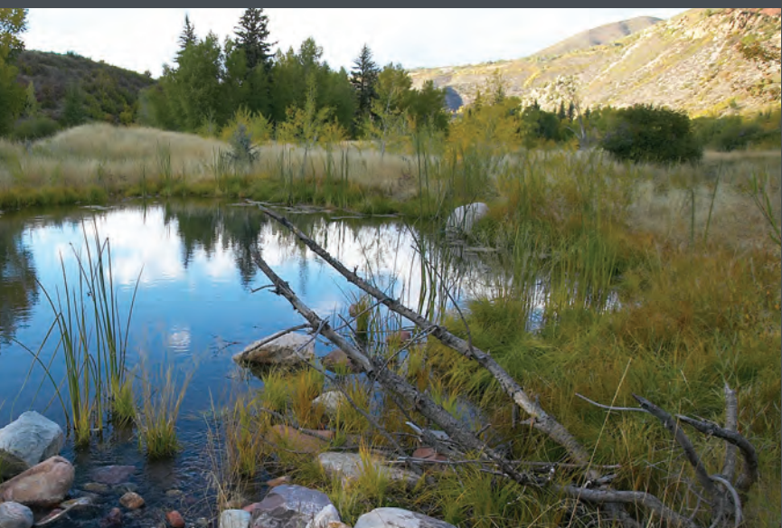
Humedales de Maroon Creek / Aspen Parks Department