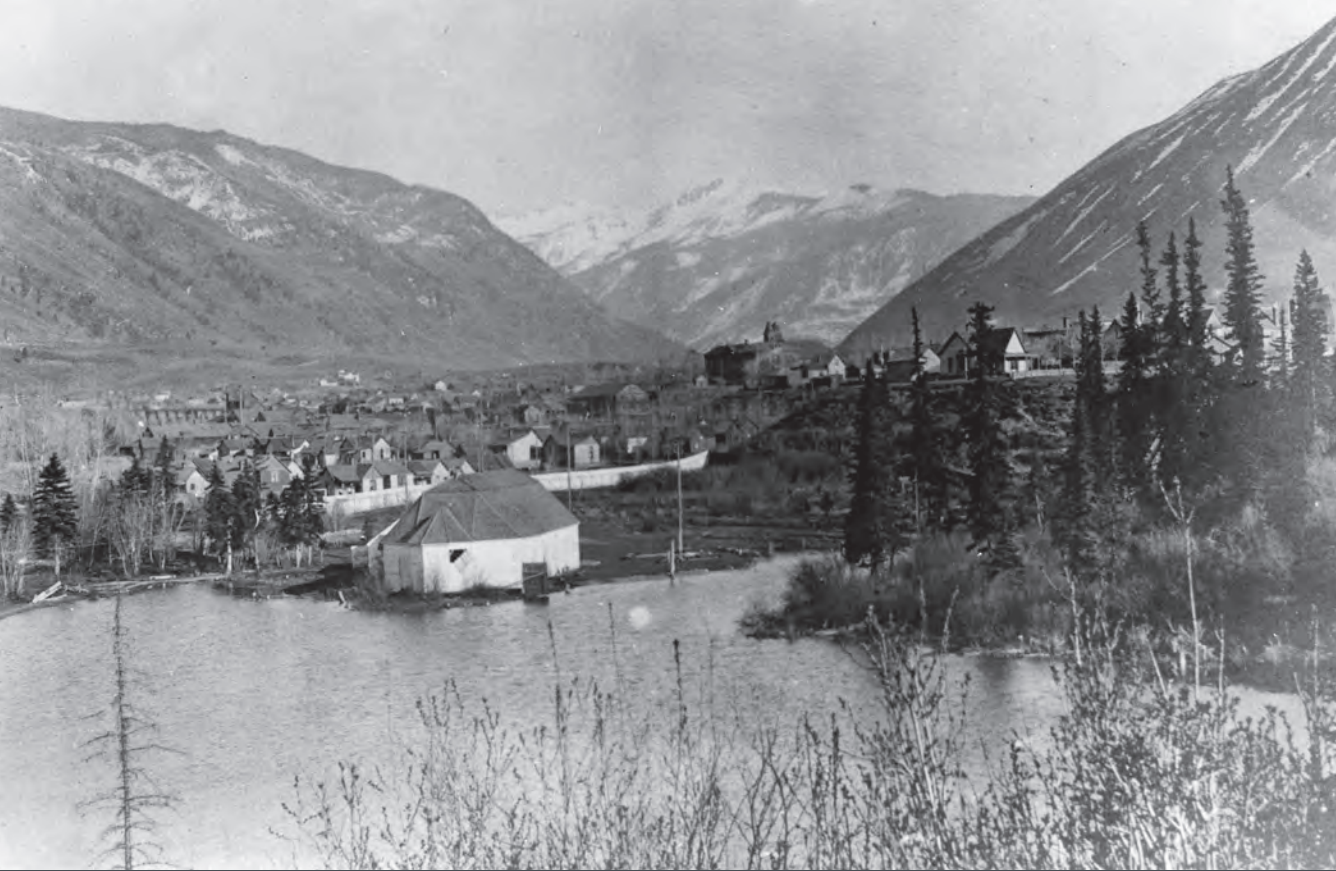
En esta fotografía de 1910 se puede apreciar Lakeview Addition, a menudo denominado “La pequeña Italia,” al otro lado del salón de baile del lago Hallam.