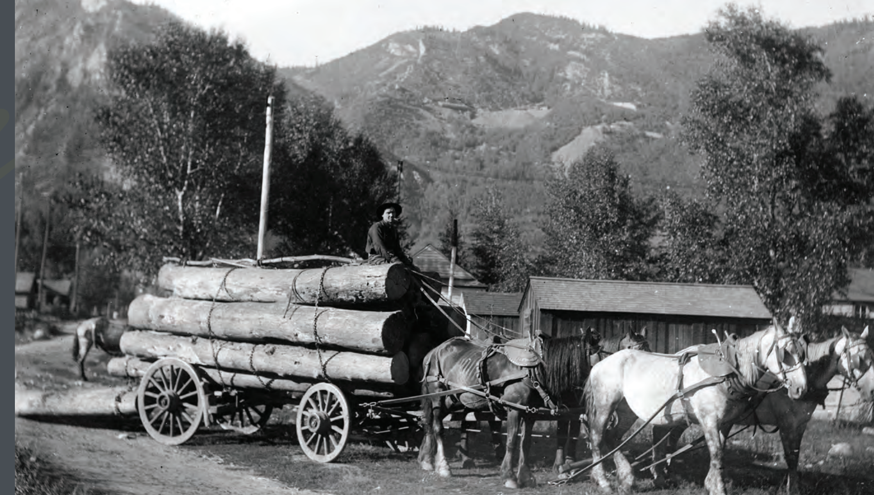
Los vagones jalados por caballos transportaban troncos desde las montañas que rodean Aspen hasta aserraderos como el de Jennie.